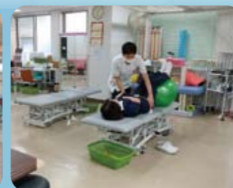
▲リハビリテーション室