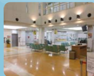
▲1階エントランスホール

今後も当院は、幅広い専門診療科とかかりつけ医機能を併せ持つ地域密着型クリニックをスローガンに、職員一丸となり努力してまいります所存ですので、引き続きご支援ご鞭撻をよろしくお願いいたします。